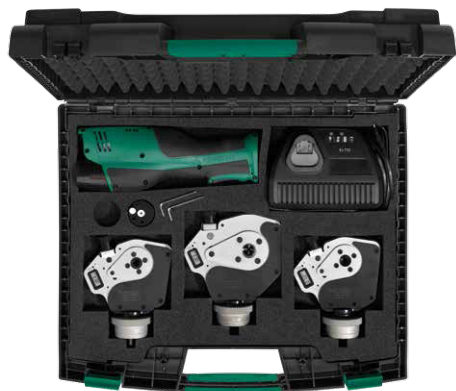
Bestückungsbeispiel Sample set

Please see our cable & connector tools catalogue for detailed information on locators or go to www.rennsteig.com